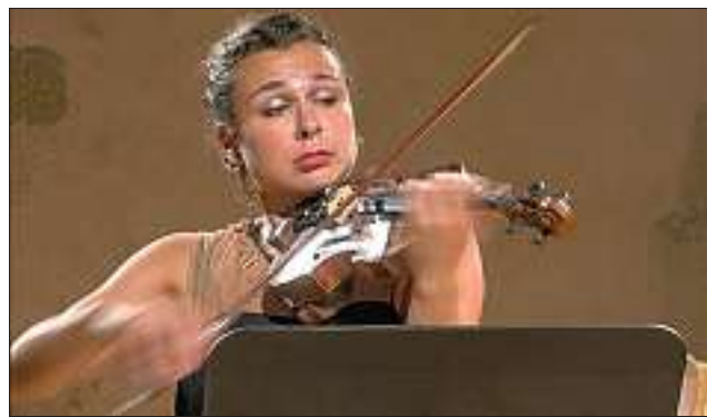
Une violoniste talentueuse et remarquable.